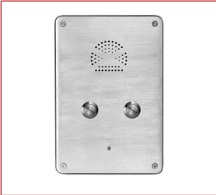
Teléfono resistente a la intemperie