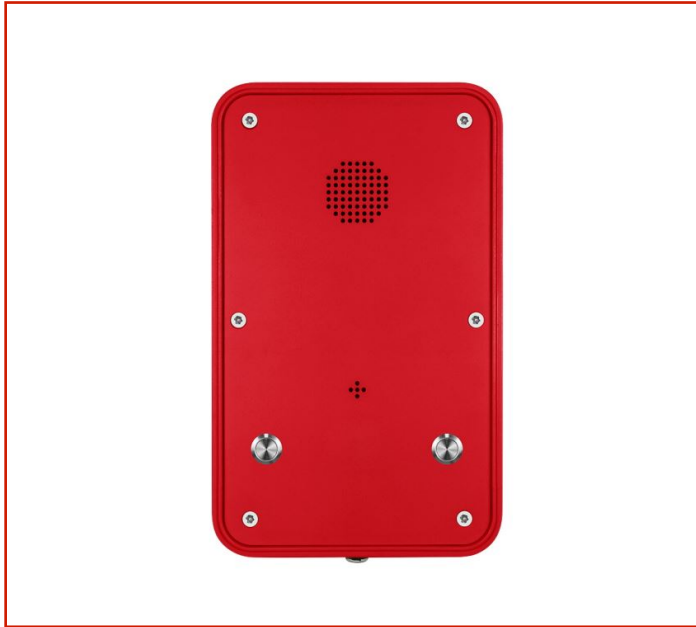
Teléfono resistente a la intemperie